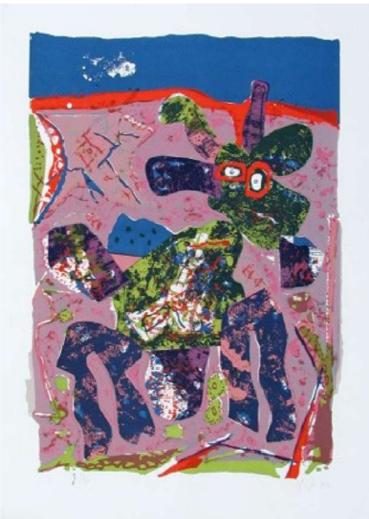
Rodolfo Nieto. Cabra azul . Serigrafía. 105 x 75 cm. 1973

verse normalmente. Mundos abigarrados de íncubos, endriagos, vestiglos y demás seres invisibles remiten a los grabados de Julio Ruelas; pero en esta obra de Sergio