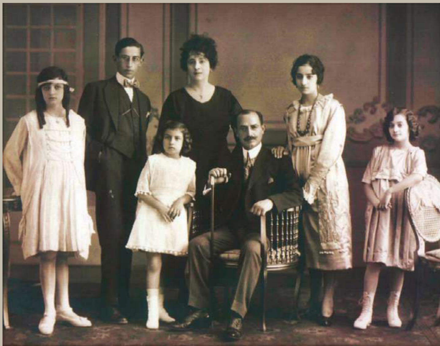
Premio Antonio García Cubas y libro La Dulce Tinta de Al-Jawater / Las Ideas