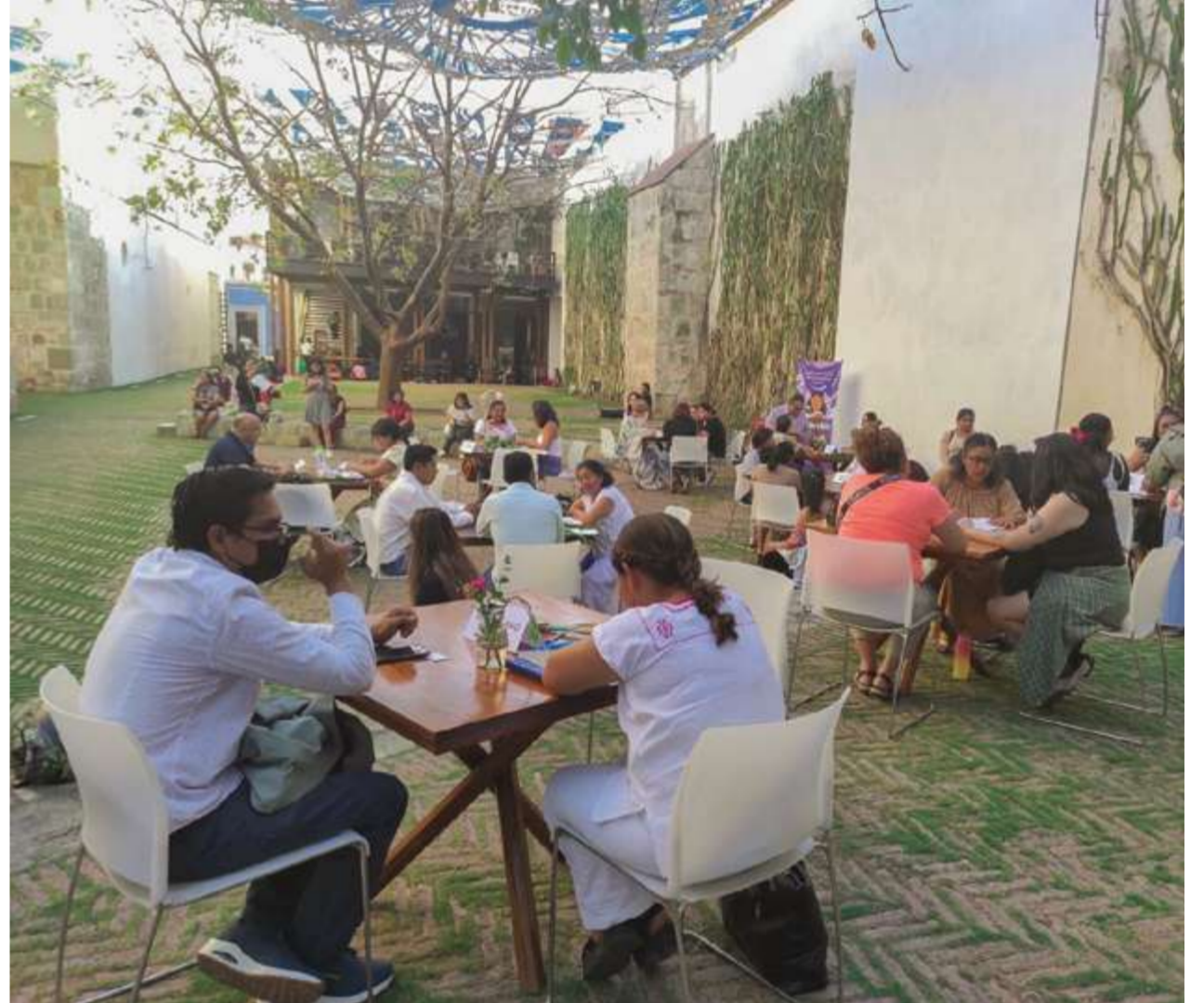
Actividades de lectura en el Centro Cultural San Pablo.

la promoción de la literatura infantil y juvenil el punto de arranque hacia una nueva vida.