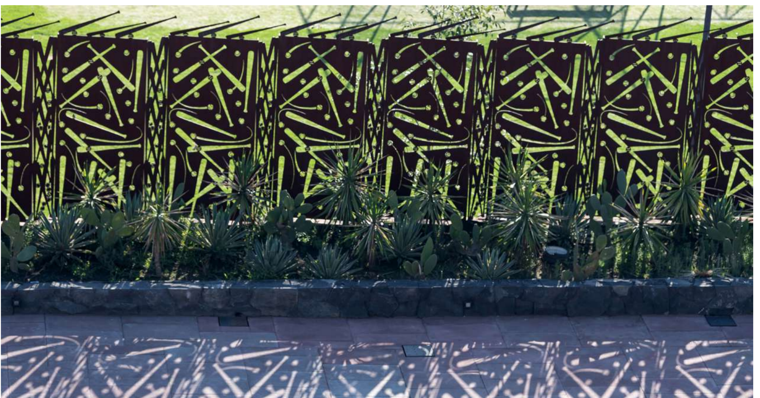
Las rejas en el MIO, en el CCSP, Casa Independencia y Estadio Alfredo Harp Helú, obras de Francisco Toledo.