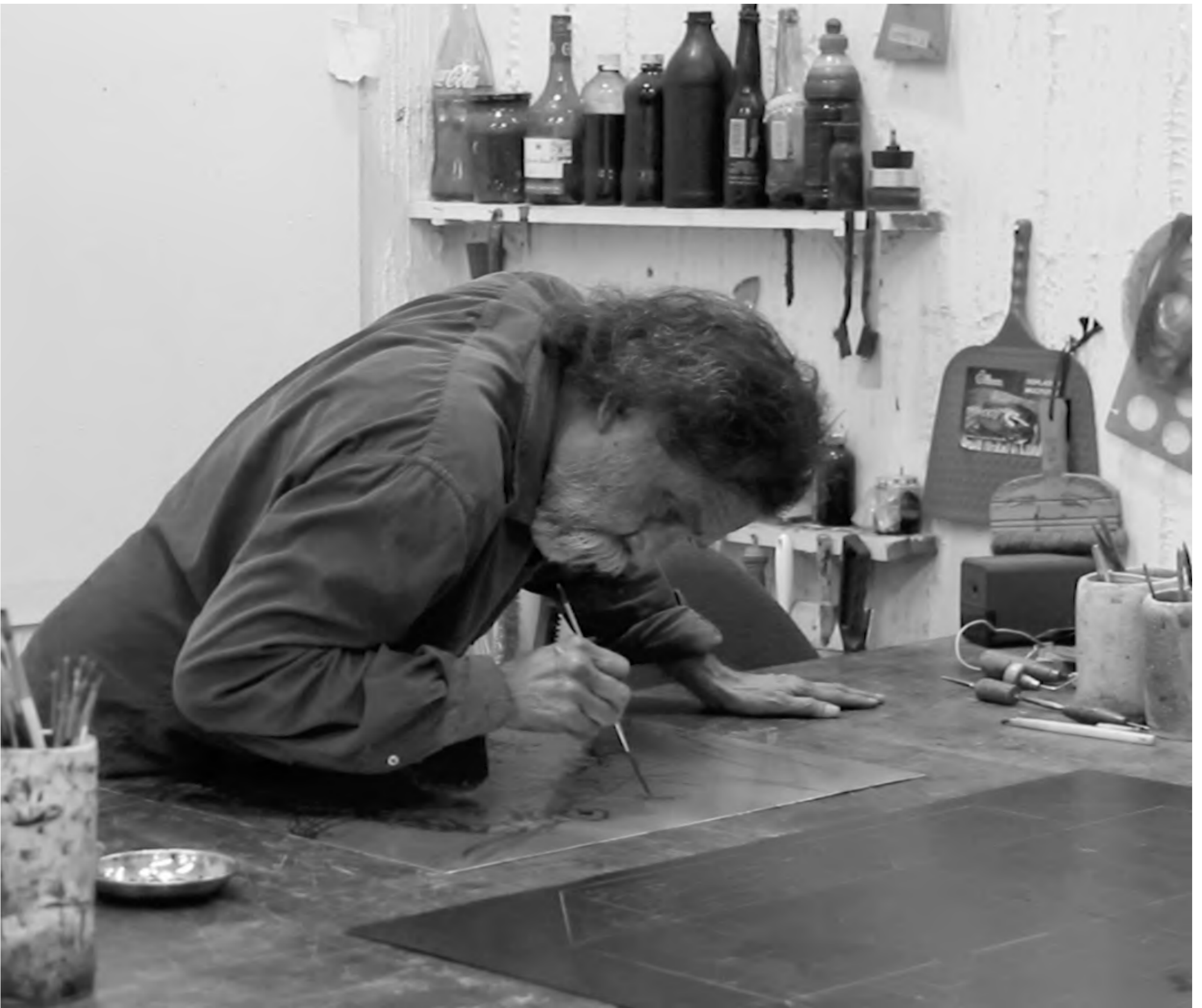
Fotografía: Maestro Toledo realizando un grabado en el taller de Fernando Sandoval.