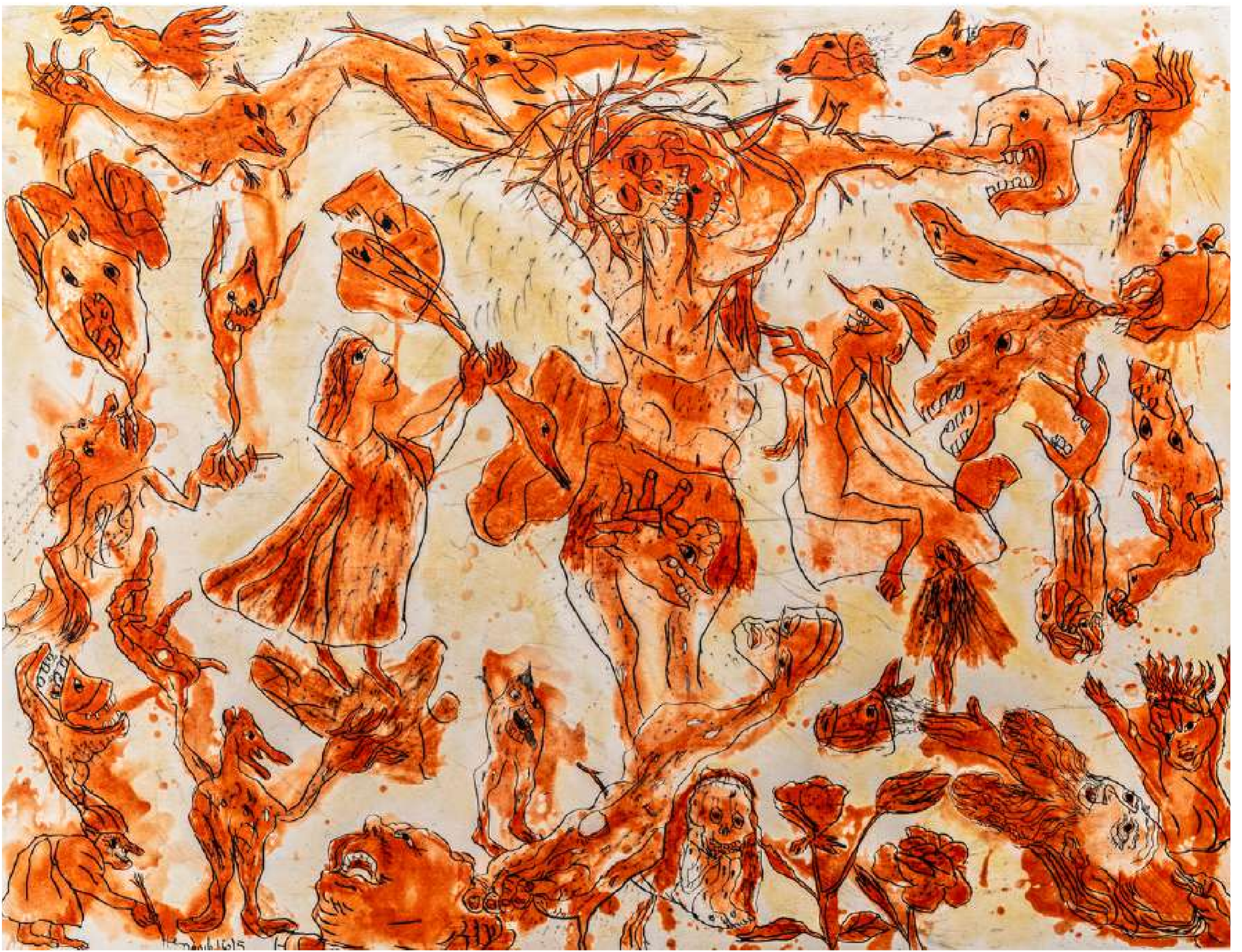
Sergio Hernández. Cristo . Aguatinta y aguafuerte. 105 x 75 cm. 2015

gráfica gracias al talento de los impresores y a su relación con los artistas, pues ambos talleres supieron propiciar un ambiente adecuado para que los artistas sintieran la confianza de explorar nuevas formas en su propio trabajo.