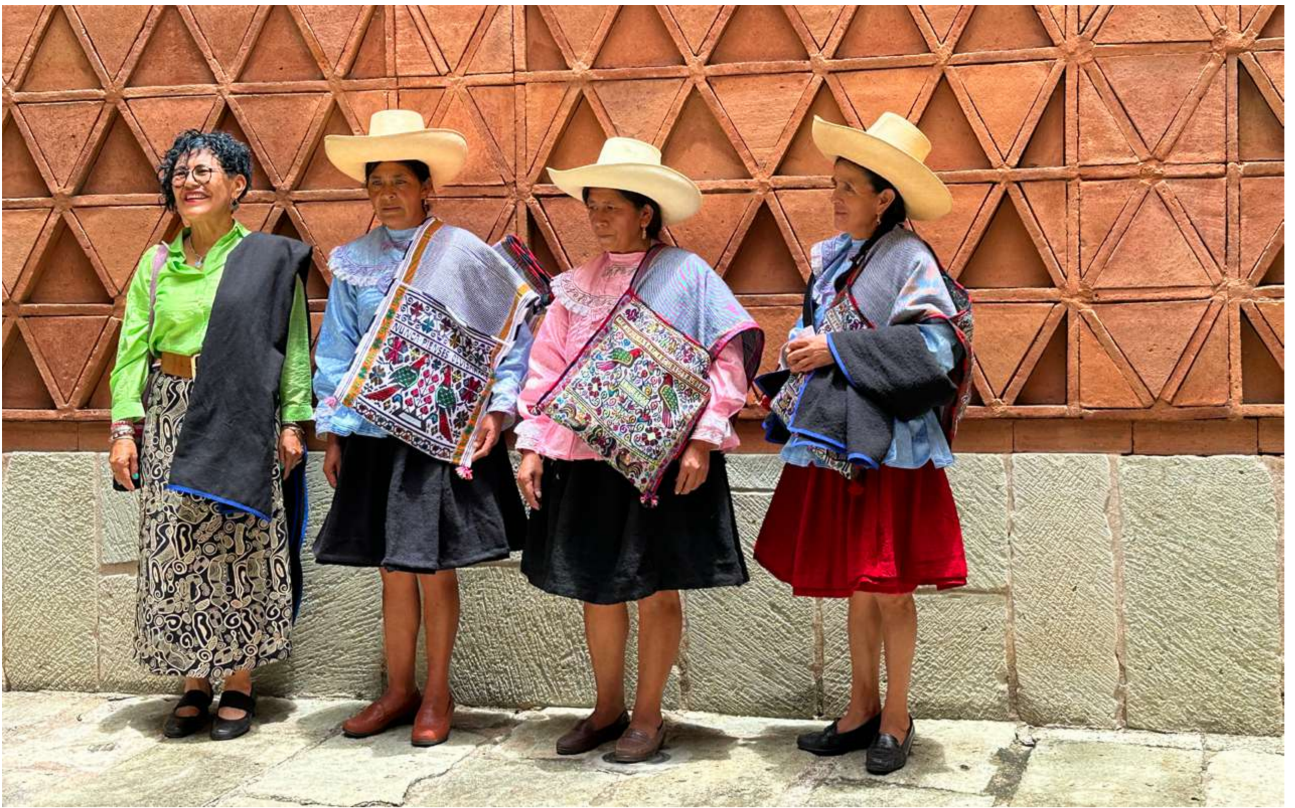
Tejedoras provenientes de Perú en el MTO.

somos parte de un mismo telar”, comentó una de las artistas al finalizar su visita.