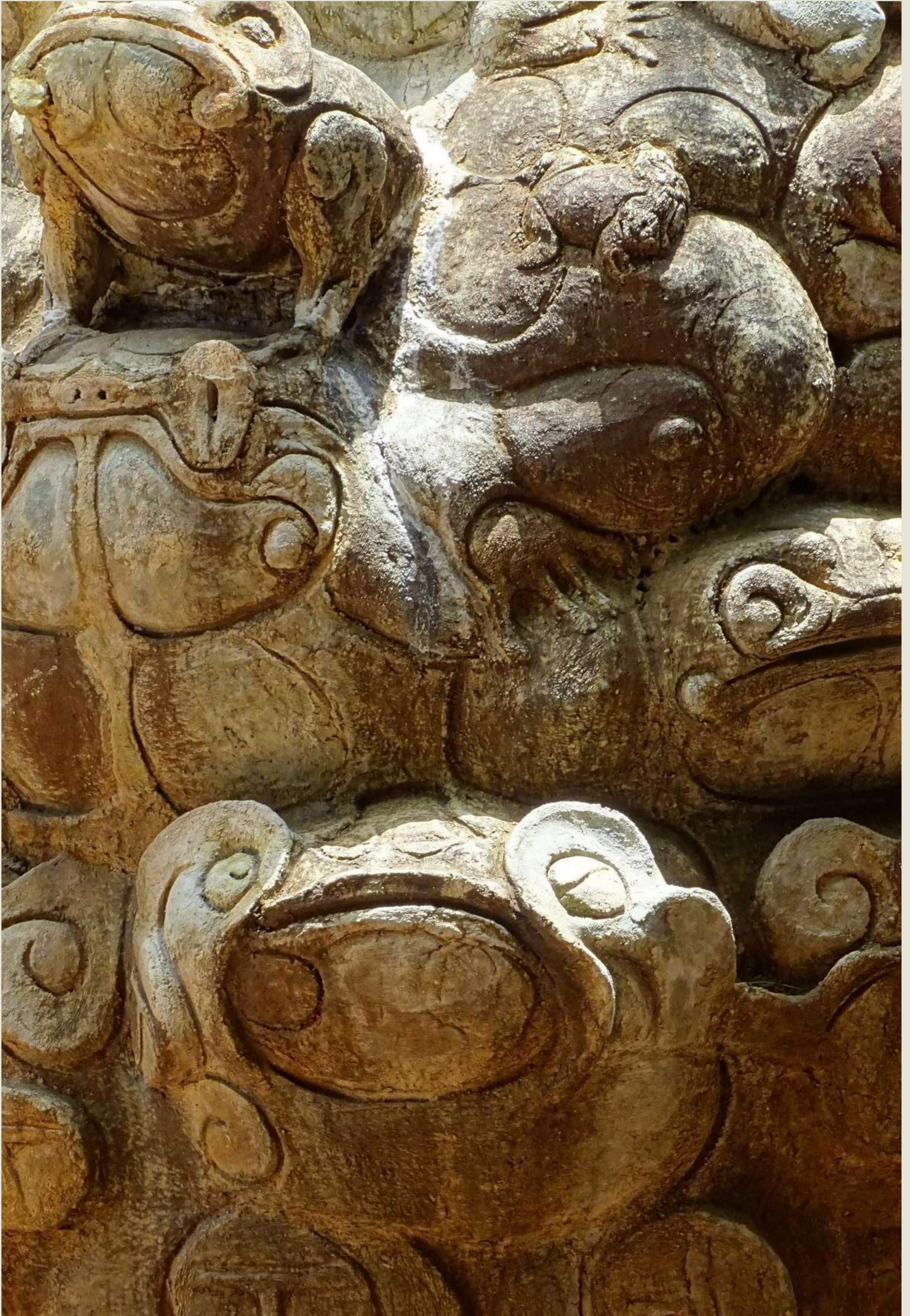
Fuente de los sapos, BS Biblioteca Infantil y Juvenil de Oaxaca